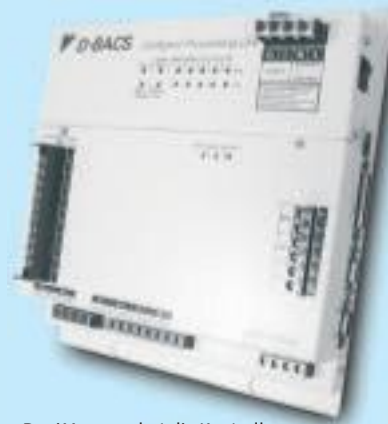
Der iManager hat die Kontrolle über die 630 DAIKIN Innengeräte des Holiday Inn Munich-City Centre.

Das VRV-System an sich arbeitet schon besonders wirtschaftlich. Durch die intelligente, kundenorientierte Zentralregelung erhöht sich die Wirtschaftlichkeit der DAIKIN Anlage noch weiter.