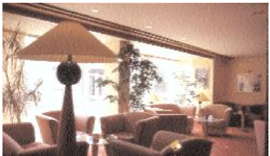
Distinguiertes Ambiente natürlich auch in der HotelLobby – eben City-Flair am Bodensee.