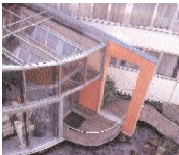
Der architektonisch eigenwillige Wintergarten- Anbau verlangte eine kreative Klima-Lösung.